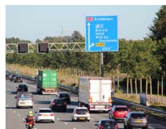
4 Tips voor werkgevers