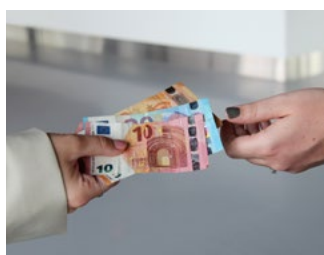
3 Tips voor de bv en de dga