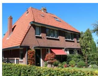
6 Tips voor de woningeigenaar