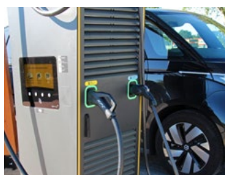
5 Tips voor de automobilist