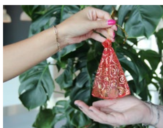
7 Tips inzake de btw